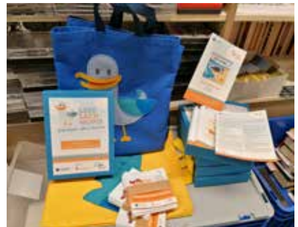
LeseLachmöwe - Ein Programm zur Leseförderung