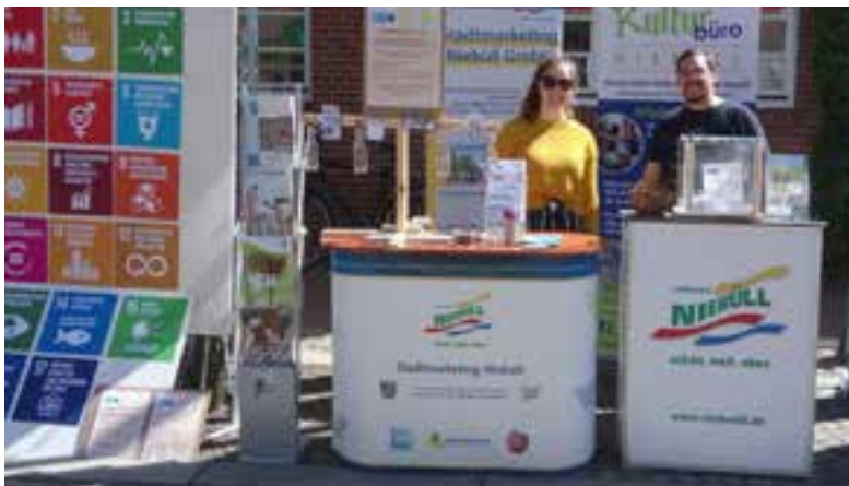
Infostand zu den 17 globalen Nachhaltigkeitszielen (SDGs) beim Niebüller Hauptstraßenvergnügen

Im Folgenden sind einige Beispiele skizziert, wie die zukünftigen Aktivitäten der Stadt Niebüll zur weiteren Umsetzung der Nachhaltigkeitsziele beitragen: