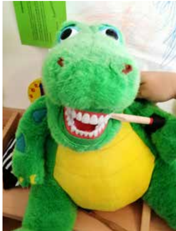
Nachhaltigkeit beginnt schon in der Kita - Zahnprophylaxe mit einer Bambuszahnbürste

Bei der Tafel ist man entsetzt, dass es Tafeln überhaupt geben muss und ein Missverhältnis in der Gesellschaft besteht: Auf der einen Seite existiert die Überproduktion mit immer vollen Regalen und den aussortierten Waren, die sonst im Müll landen würden; auf der anderen Seite gibt es die bedürftigen Menschen. Einer der wichtigsten Grundsätze der Tafelbewegung ist daher auch das Retten von Nahrungsmitteln.