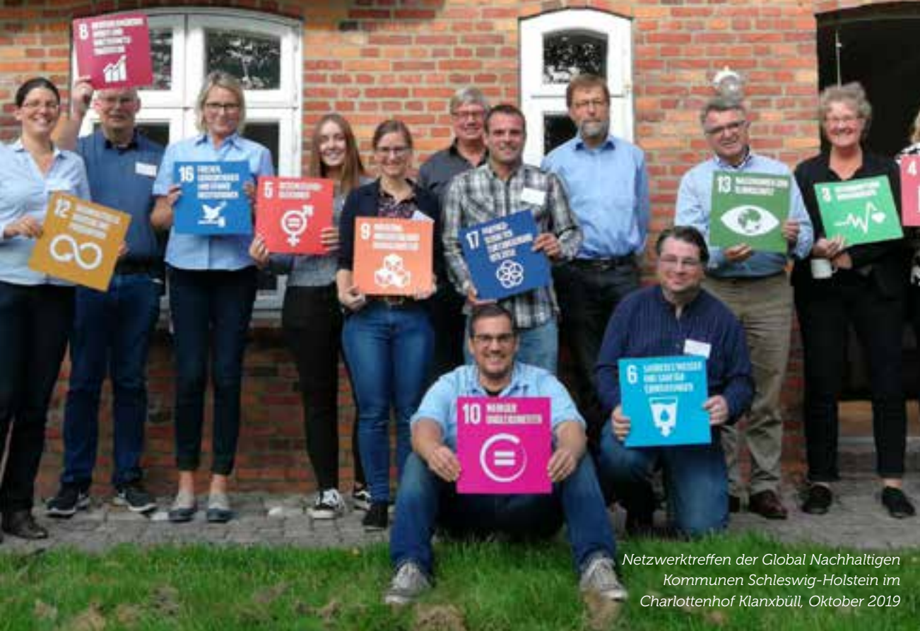
Netzwerktreffen der Global Nachhaltigen Kommunen Schleswig-Holstein im Charlottenhof Klanxbüll, Oktober 2019