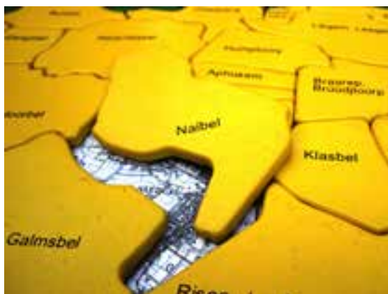
Gemeindepuzzle der AktivRegion Nordfriesland Nord

Dieses Signal hat auch Niebüll als nördlichste Zeichnungskommune Deutschlands Ende Dezember 2018 gesetzt. In der Stadt versteht man die Musterresolution als Selbstverpflichtung sowie als Signal an die Einwohner*innen, dass Niebüll ihren politischen und kommunalen Pflichten im Bewusstsein nachhaltigen Agierens nachkommt und Akteurin für die Umsetzung der Agenda 2030 vor Ort ist. Es gilt nun, die bisherigen Erkenntnisse und Erfahrungen zu nutzen, darauf aufzubauen, Neues mit Altem zu verknüpfen und nachhaltige Entwicklung zu einer der dringlichsten Aufgaben zu erklären.